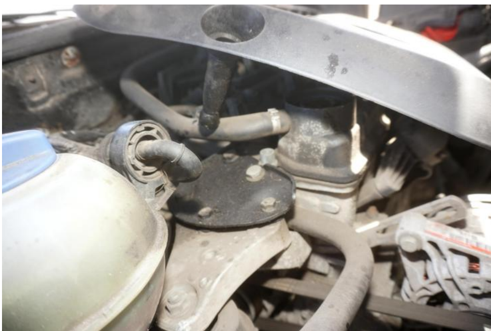
Fot. 12. zapocenie olejowe wylotu przewodu odpowietrzania