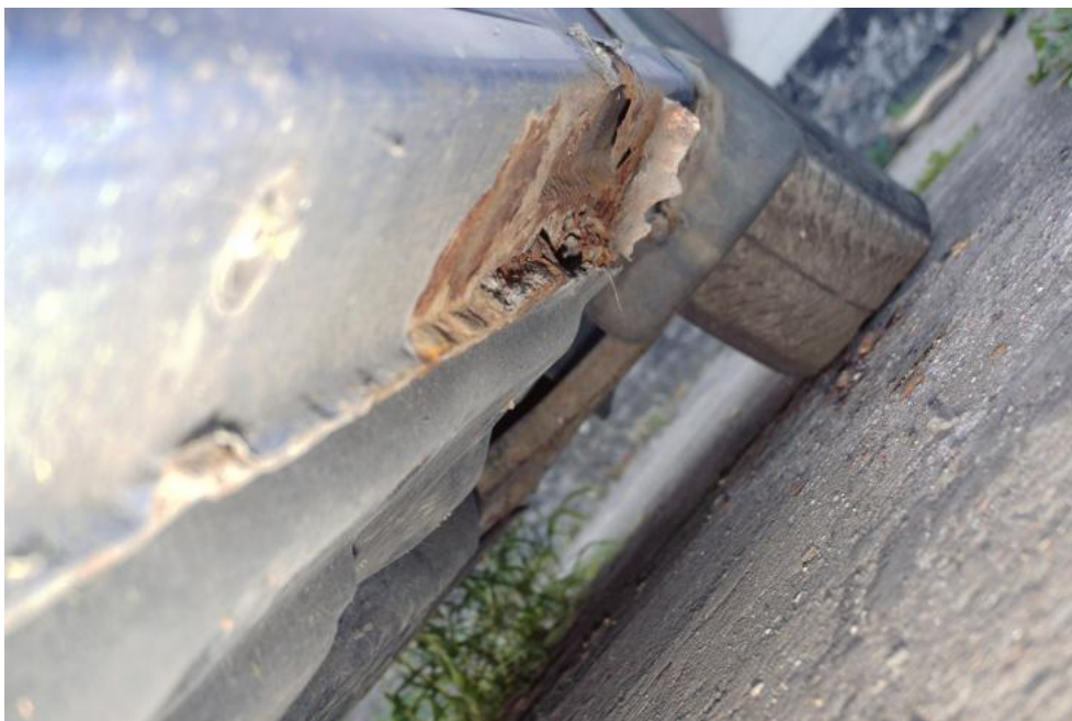
Fot. 35. ubytki korozyjne progu