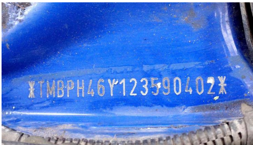
Fot. 6. numer VIN