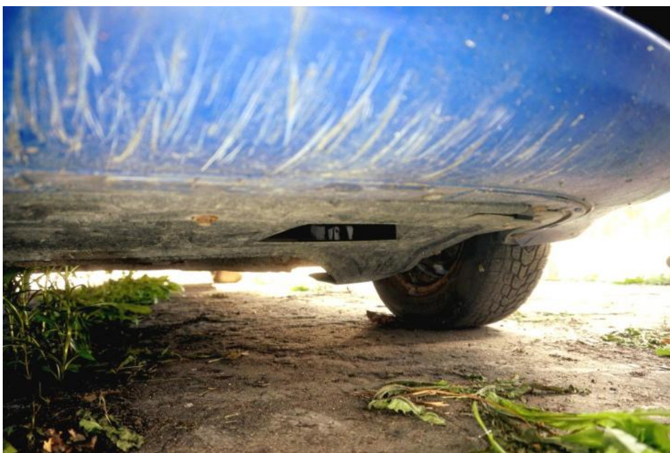
Fot. 32. zarysowania lakieru na zderzaku tylnym