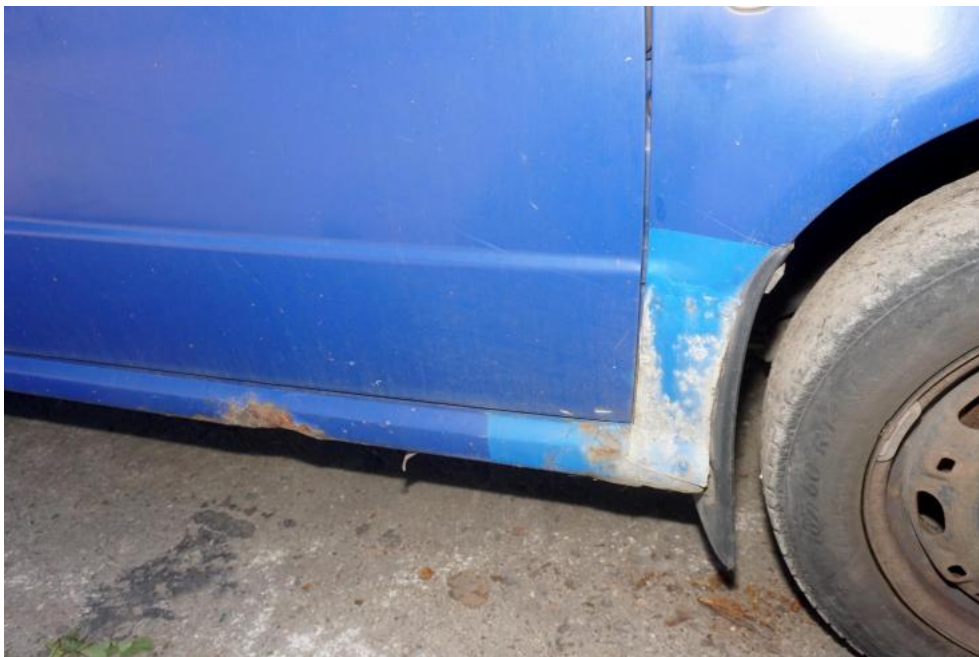
Fot. 27. korozja błotników przednich