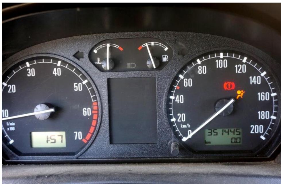
Fot. 19. wskazania przebiegu