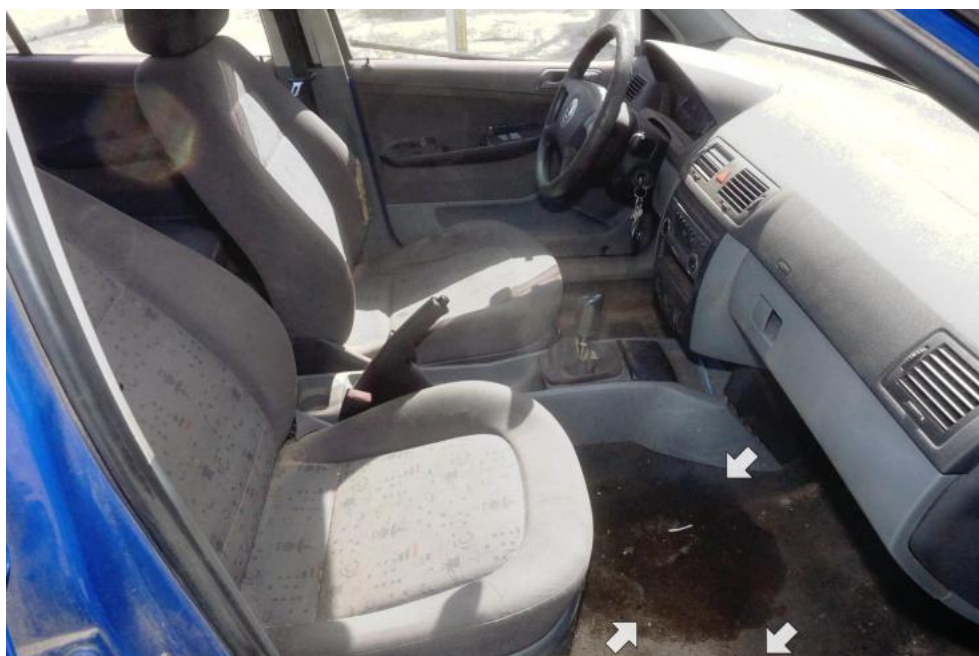
Fot. 20. uszkodzenia dywanika podłogowego