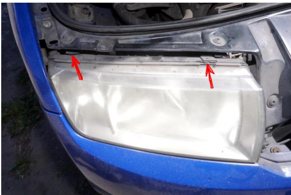
Fot. 14. połamane uchwyty reflektora