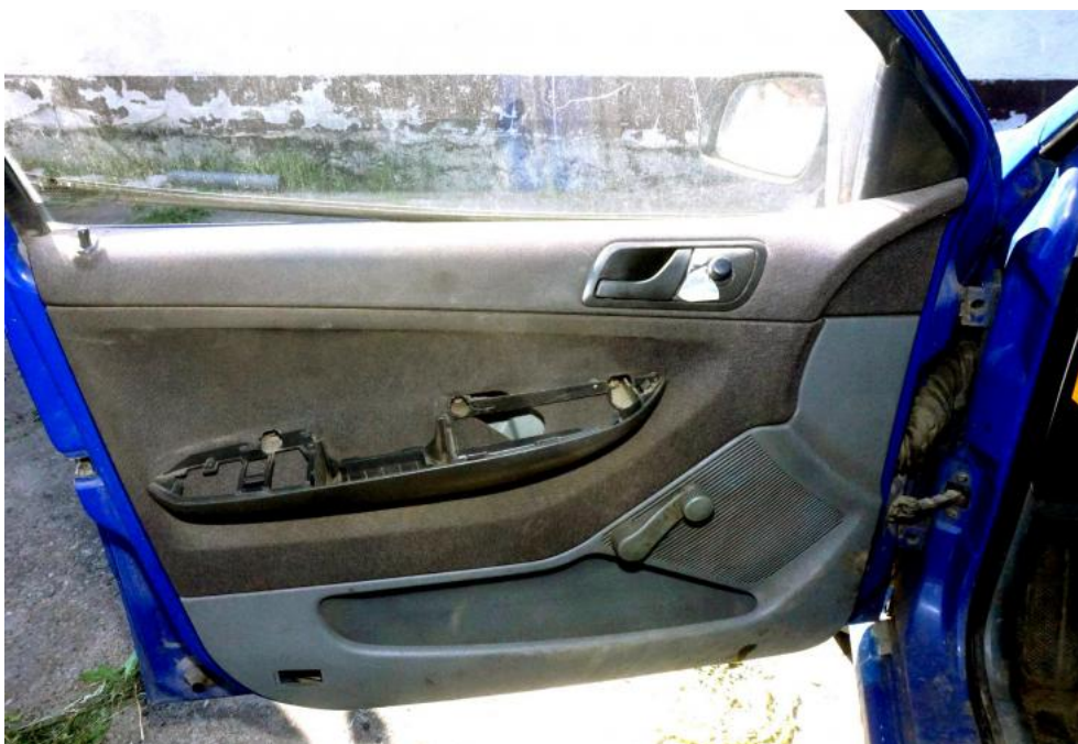
Fot. 16. popękany podłokietnik drzwi