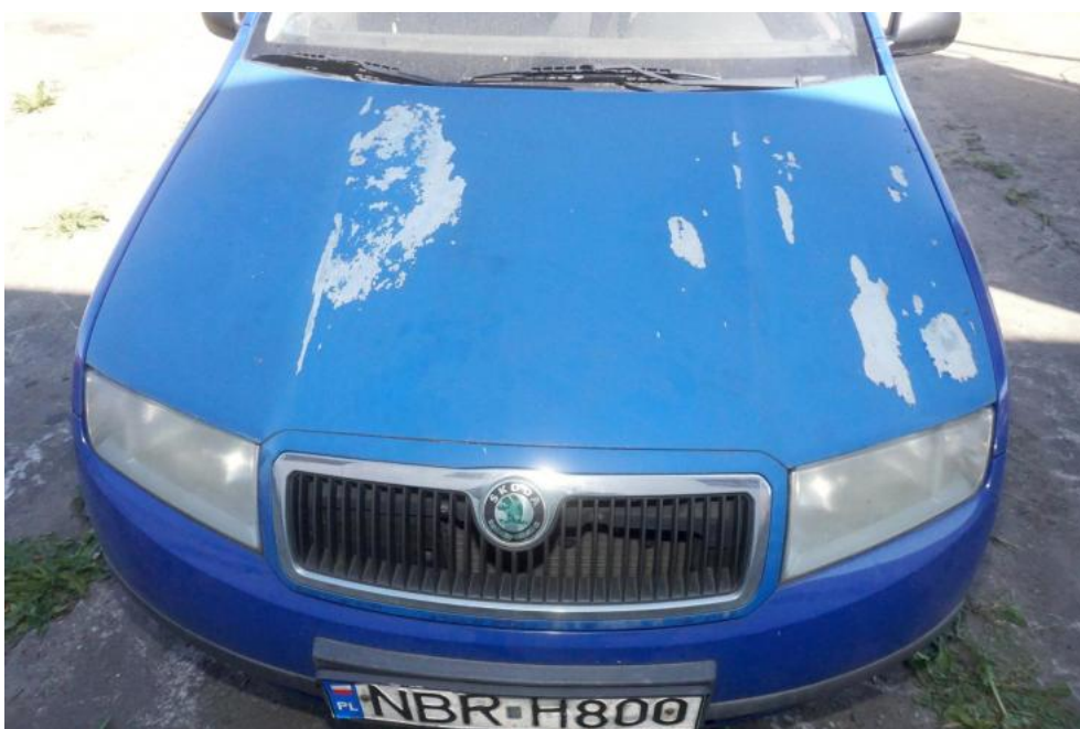
Fot. 8. złuszczenia lakieru