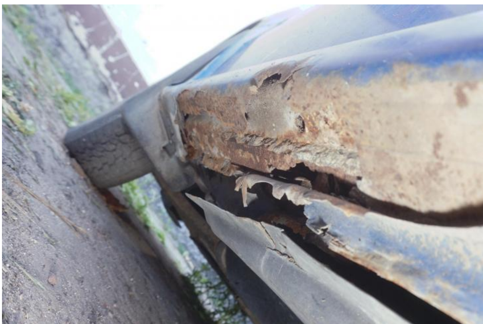
Fot. 34. ubytki korozyjne prog, przednia część