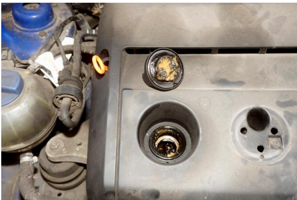
Fot. 11. szlam wodno-olejowy pod korkiem wlewu oleju