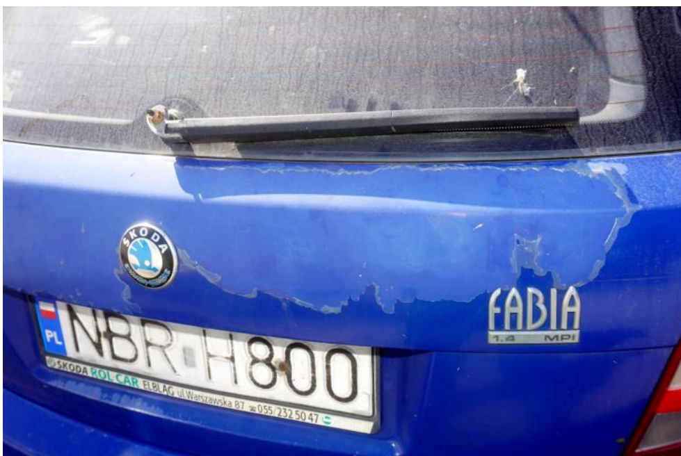
Fot. 30. złuszczenia lakieru na pokrywie tylnej