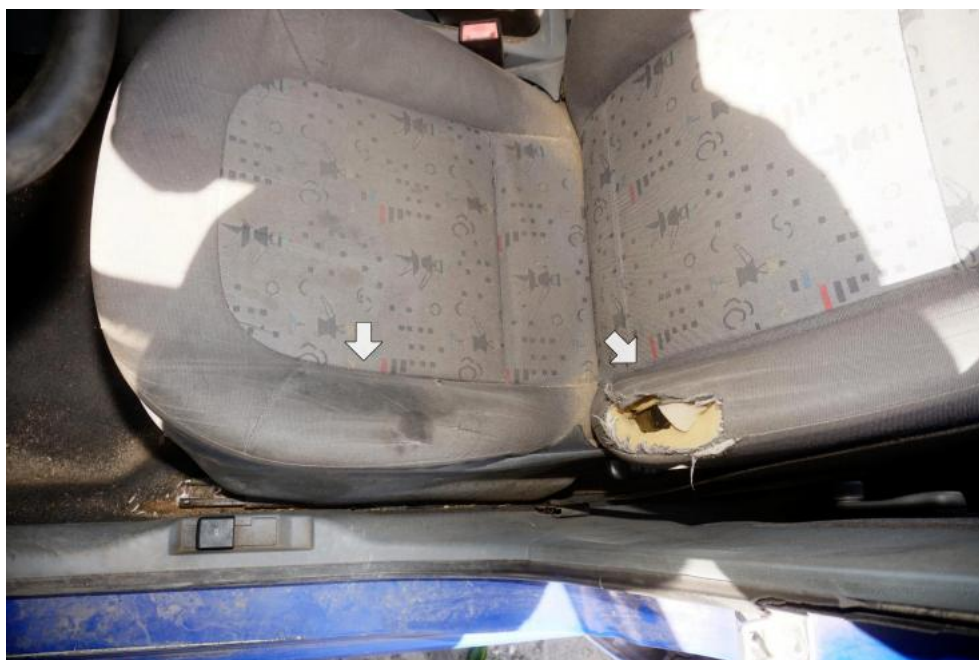
Fot. 21. uszkodzenia tapicerki foteli