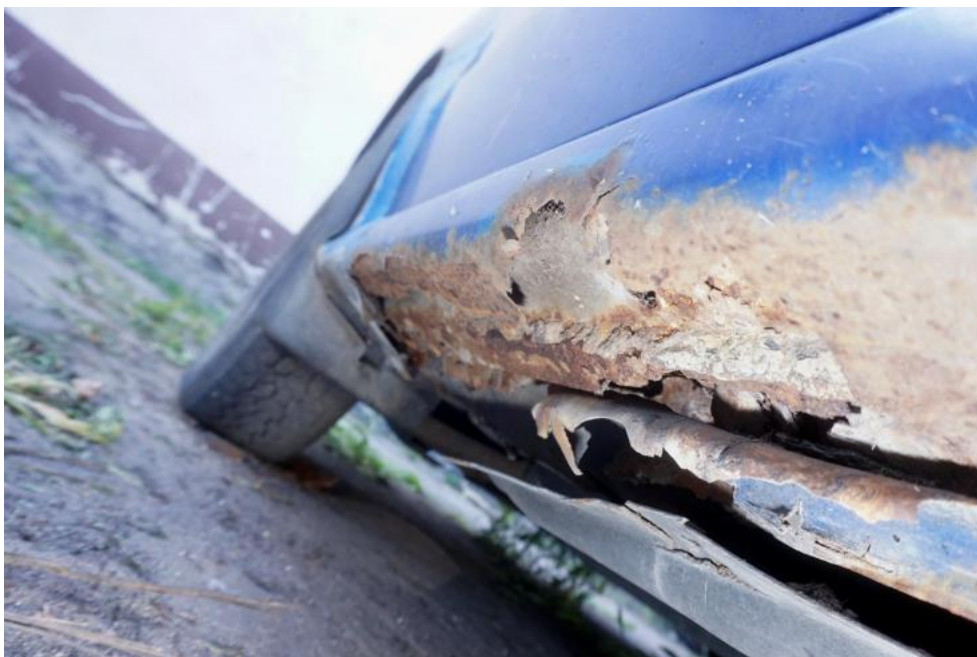
Fot. 33. ubytki korozyjne prog, przednia część