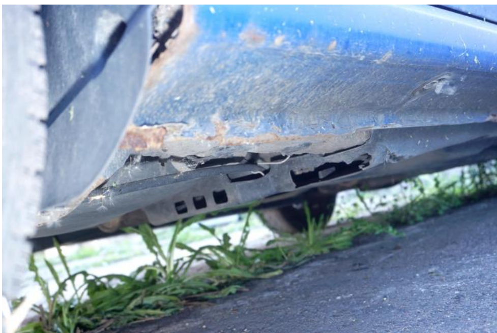
Fot. 36. korozja progu tylnego