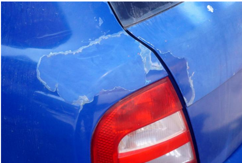
Fot. 29. złuszczenia lakieru z tyłu nadwozia