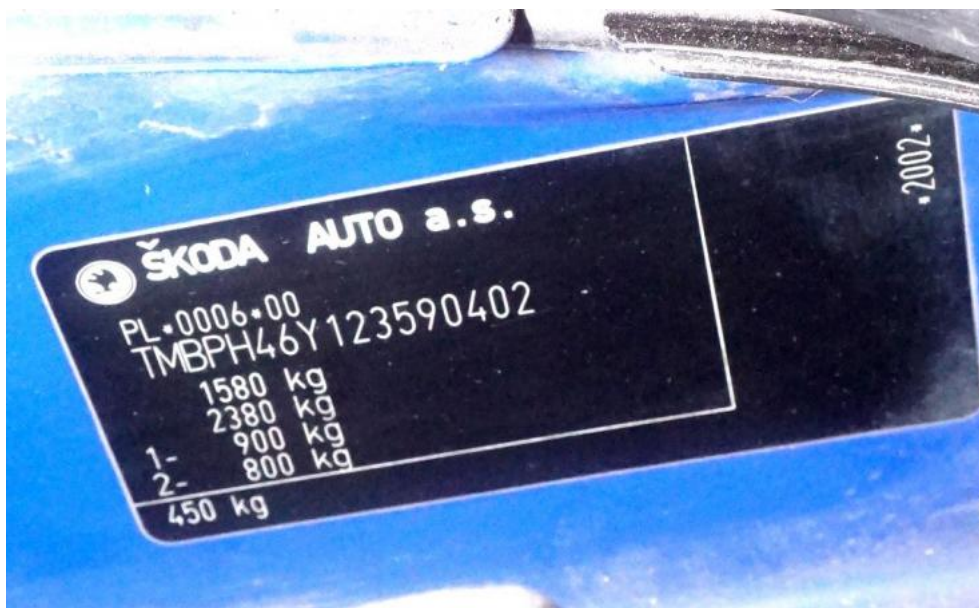
Fot. 7. tabliczka znamionowa