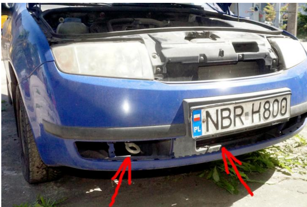
Fot. 13. połamane kratki i osłony zderzaka